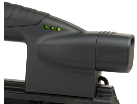
Li-Ion Akku mit Ladeanzeige